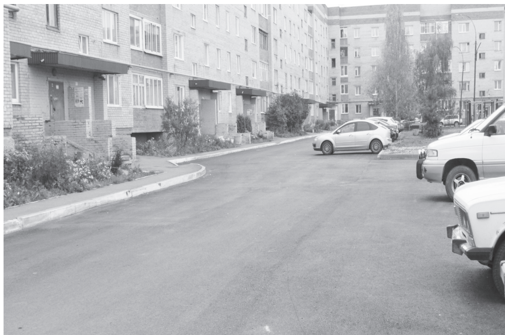
Дворовая территория на ул. Евдокимова, 32

улице Ленина в щебеночном исполнении - 876 115 руб.; - ремонт улично-дорожной сети по улицам: Евдокимова, Советская, Калинина - 3 028 605 руб.; - ремонт улично-дорожной сети по улице Карла Маркса и тротуаров по улице 8 Марта - 2 965 797 руб.;