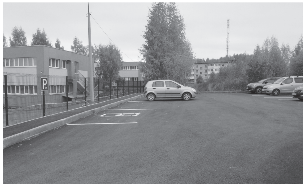
Парковка около детского сада

P.S. Депутаты приняли отчет к сведению и договорились с директором Службы единого заказчика о совместном рейде по